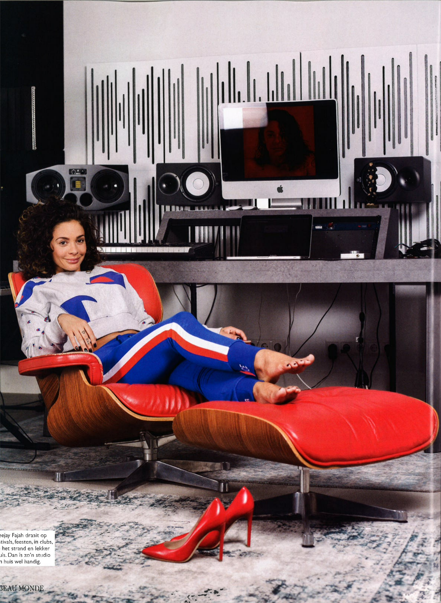
Fajah draait op festivals, feesten, in clubs, het strand en lekker huis. Dan is zo'n studio n huis wel handig.

boekje: 'Ik krijg 1 miljoen euro deze week, 1 miljoen euro deze week.' Tot ik werd gebeld dat het rond was. Ik was zo blij. Dat visualiseren werkt echt. Dat notitieboekje ligt nu naast mijn bed en daarin schrijf ik al mijn wensen. Bijvoorbeeld wat ik wil omzetten met mijn proteïnelijn. En dan krijg ik het. Ik visualiseer het niet alleen, het is ook onderbouwd. Ik zeg niet 'Ik wil een miljoen omzet' als ik niet weet hoe. Ik zet er ook andere dingen in; 'Ik hou van mezelf, ik hou van mezelf. Ik heb mezelf onder controle.' Het werkt echt! Ik ben ermee begonnen toen ik het boek 'Think and grow rich' had gelezen. Een aanrader."