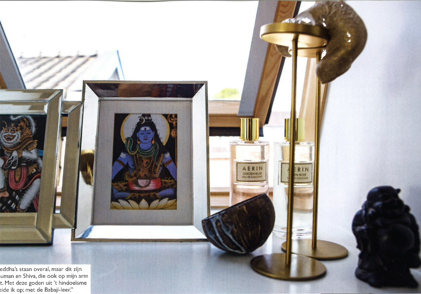
...edha's staan overal, maar dit zijn Hanuman en Shiva, die ook op mijn arm staan. Met deze goden uit 't hindoeïsme heb ik ik op; met de Babaji-leer."